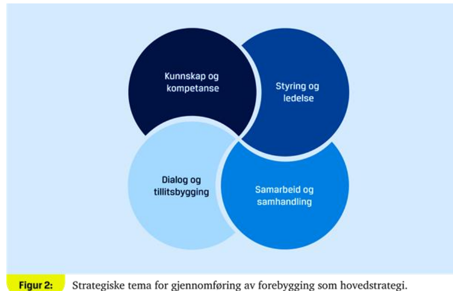
Figur 2: Strategiske tema for gjennomføring av forebygging som hovedstrategi.