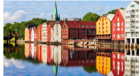
Trondheims gamle hovedstad år 1030-1217